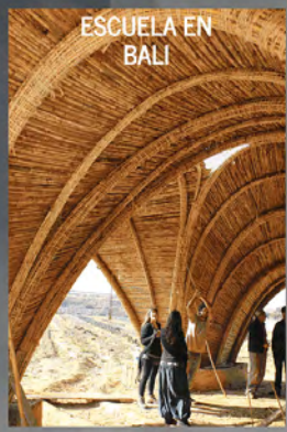
ESCUELA EN BALI