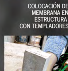
COLOCACIÓN DE MEMBRANA EN ESTRUCTURA CON TEMPLADORES