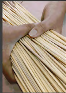
JUNTAR EL JUNCO CON LA TOTORA AL CENTRO