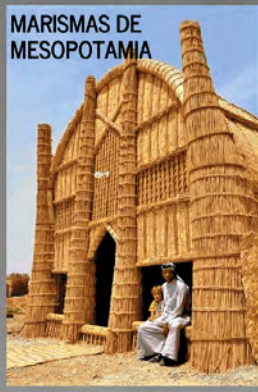
MARISMAS DE MESOPOTAMIA